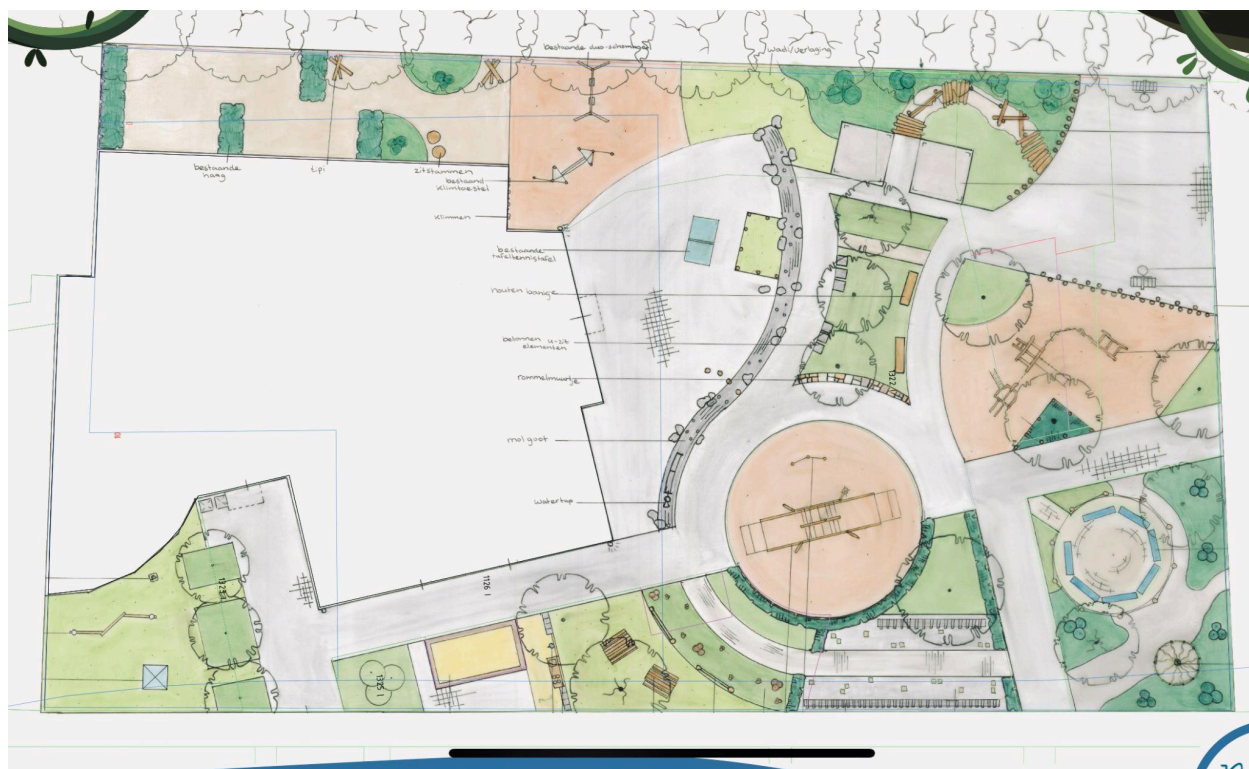
Concept ontwerp van het nieuwe schoolplein